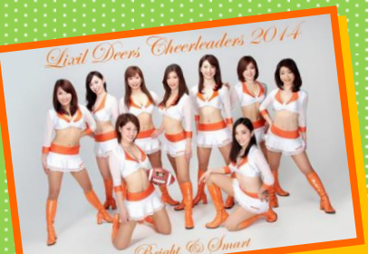
リクシルティアース