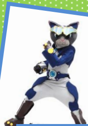
ギャネックの ヒーローショー